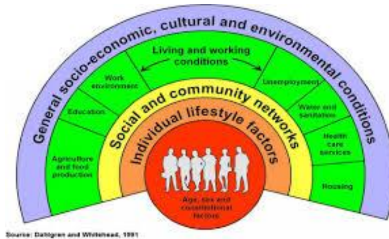
Figura – Diagrama de los determinantes sociales de salud – Rainbow model